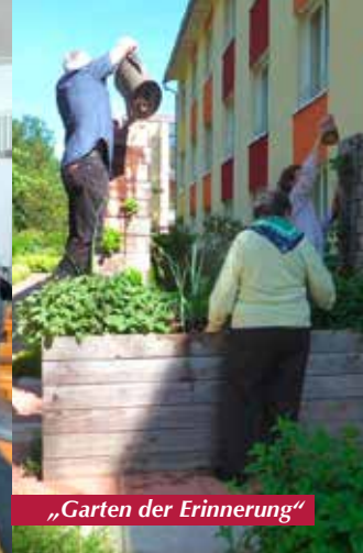
„Garten der Erinnerung“