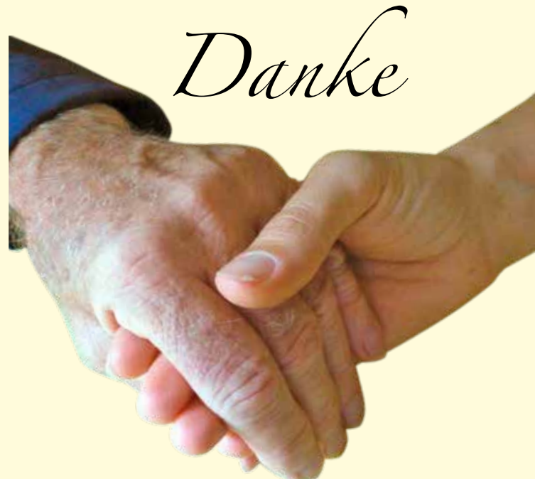
Gesamtherstellung: Dreisam Druck Kirchzarten

Bankverbindung: DE85 6805 1004 0004 3705 81 BIC: SOLADES1HSW