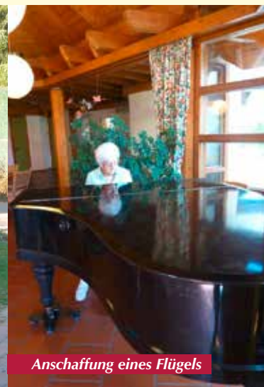
Anschaffung eines Flügels