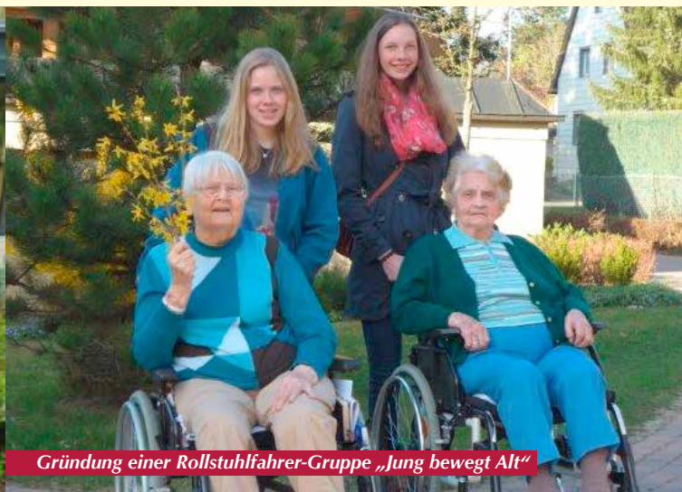
Gründung einer Rollstuhlfahrer-Gruppe „Jung bewegt Alt“