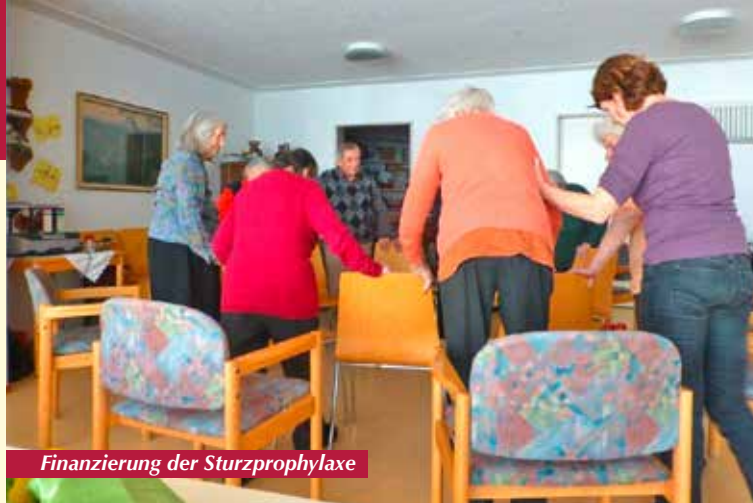
Finanzierung der Sturzprophylaxe