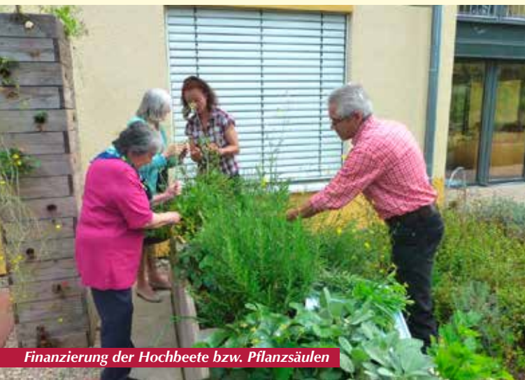
Finanzierung der Hochbeete bzw. Pflanzsäulen

Um weitere sinnvolle Aktivitäten oder Anschaffungen „fördern“ zu können, ist der Förderverein auf Mitglieder und Gönner angewiesen. Es wäre daher wünschenswert, wenn sich viele Bürgerinnen und Bürger aus dem Dreisamtal und der Umgebung zu einer Mitgliedschaft entschließen könnten.